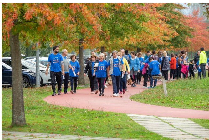
caminhada de pequena rota (passeio) e aula de Pilates.